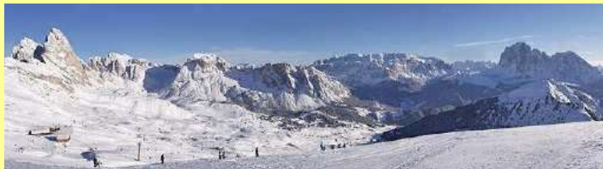
Die Skiregion Fleimstal in den Dolomiten